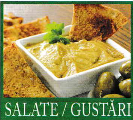
SALATE / GUSTĂRI